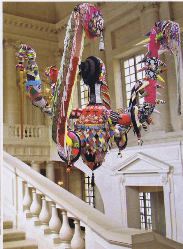
Simulations des installations de Joana Vasconcelos au château de Versailles (de gauche à droite) : Cœur Indépendant Rouge (2005) dans le Salon de la paix ; Marilyn (2011) dans la Galerie des glaces ; Mary Poppins (2010) dans l'escalier Gabriel.

seront disposées des chaussures réalisées à partir de casseroles. La guerre et la paix encerclant l'espérance. Le cœur réalisé à partir de couteaux et de fourchettes se réfère à une tradition du pays d'origine de l'artiste, le Portugal, les femmes portant un tel pendentif le jour de leur mariage pour signifier le luxe. Face aux escarpins modèle Marilyn Monroe, la tradition rencontre la contemporanéité de la star américaine. Après la femme protectrice, la femme contemporaine et la mariée, apparaît la femme guerrière . Nous sommes dans la Galerie des batailles. Cinq pièces suspendues de 6 à 16 mètres de long représenteront les Valkyries, ces déesses qui survolaient les champs de bataille et sauvaient les guerriers les plus valeureux. La dorée symbolise le luxe, la royale se pare de brocart, l'éthérée est en soie naturelle, celle réalisée en matériaux de recyclage représente l'excès, et enfin, avec la rurale, Joana Vasconcelos parfait l'image de la femme et de ses multiples facettes. Parce qu'elle veut aussi parler