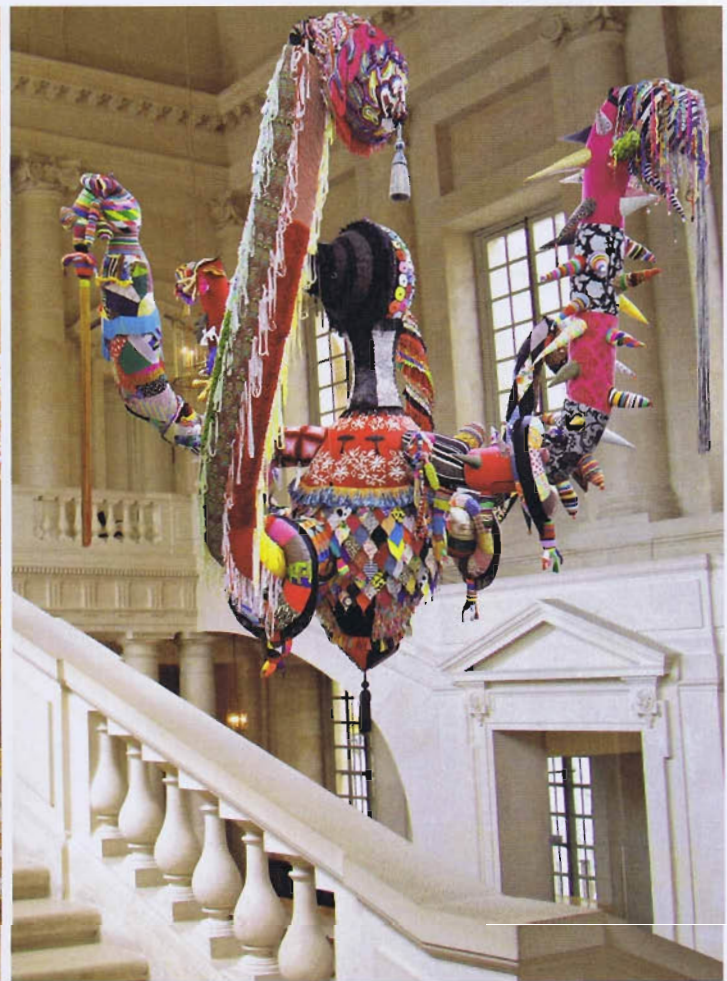
Simulations des installations de Joana Vasconcelos au château de Versailles (de gauche à droite) : Cœur Indépendant Rouge (2005) dans le Salon de la paix ; Marilyn (2011) dans la Galerie des glaces ; Mary Poppins (2010) dans l'escalier Gabriel.

seront disposées des chaussures réalisées à partir de casseroles. La guerre et la paix encerclant l'espérance. Le cœur réalisé à partir de couteaux et de fourchettes se réfère à une tradition du pays d'origine de l'artiste, le Portugal, les femmes portant un tel pendentif le jour de leur mariage pour signifier le luxe. Face aux escarpins modèle Marilyn Monroe, la tradition rencontre la contemporanéité de la star américaine. Après la femme protectrice, la femme contemporaine et la mariée, apparaît la femme guerrière . Nous sommes dans la Galerie des batailles. Cinq pièces suspendues de 6 à 16 mètres de long représenteront les Valkyries, ces déesses qui survolaient les champs de bataille et sauvaient les guerriers les plus valeureux. La dorée symbolise le luxe, la royale se pare de brocart, l'éthérée est en soie naturelle, celle réalisée en matériaux de recyclage représente l'excès, et enfin, avec la rurale, Joana Vasconcelos parfait l'image de la femme et de ses multiples facettes. Parce qu'elle veut aussi parler